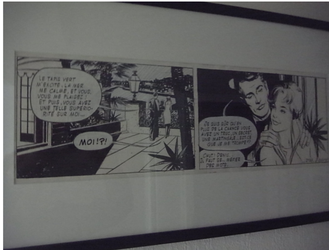
13, rue de l'Espoir par Paul Gillon

avec ce strip de Gimon que je possède depuis près de dix ans, acheté lors de la très belle exposition Les Femmes de Gimon de l'éphémère Galerie Champaka de Paris et que je ne me lasse jamais de regarder... :