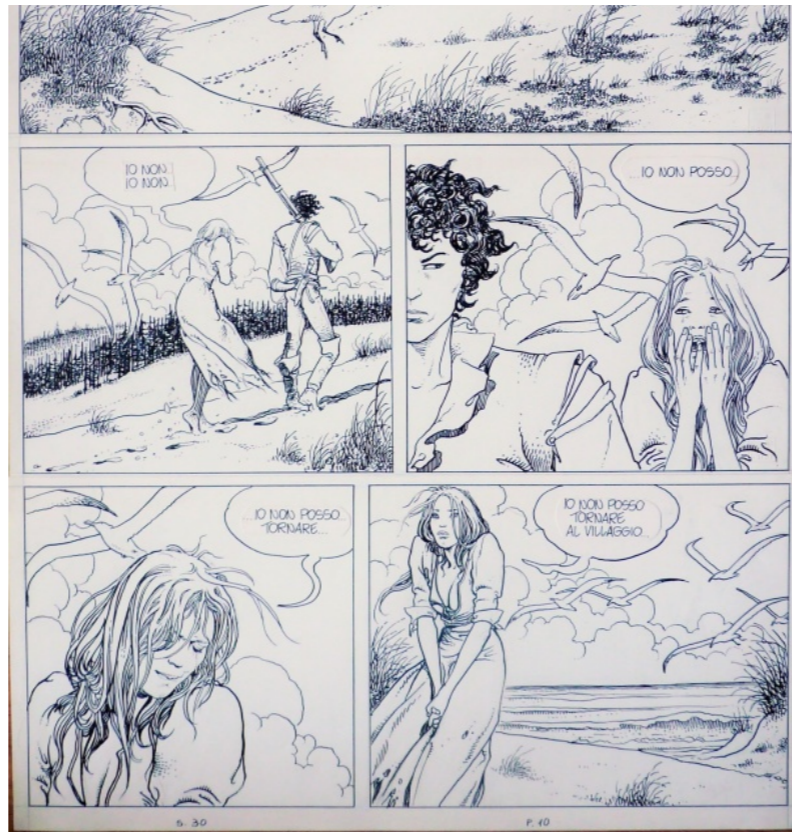
"Un été Indien" par Manara, dans la collection de Difool

Mais il n'est pas dit que j'en profiterais pas pour faire le casse du siècle car c'est pas la seule pièce de sa collection qui me fait de l'oeil ! Attention à toi Difool :-)