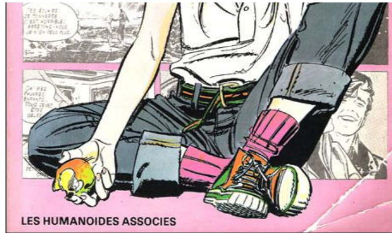
Couverture de 13, rue de l'Espoir par Gillon

J'ai cherché à en avoir un. Si à cette époque de cocagne, dont je n'ai pas su pleinement profiter, on pouvait trouver facilement des pièces pour un budget raisonnable, il m'a fallu quelques années avant que je concrétise.