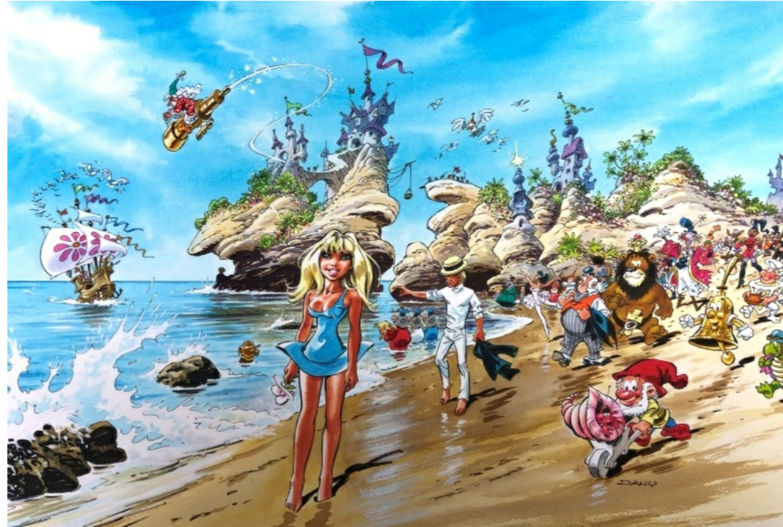
L'univers d'Olivier Rameau par Dany, illustration dans la collection d'Ambreville

Mais aussi pour Colombe, ne soyons pas Tartuffe !