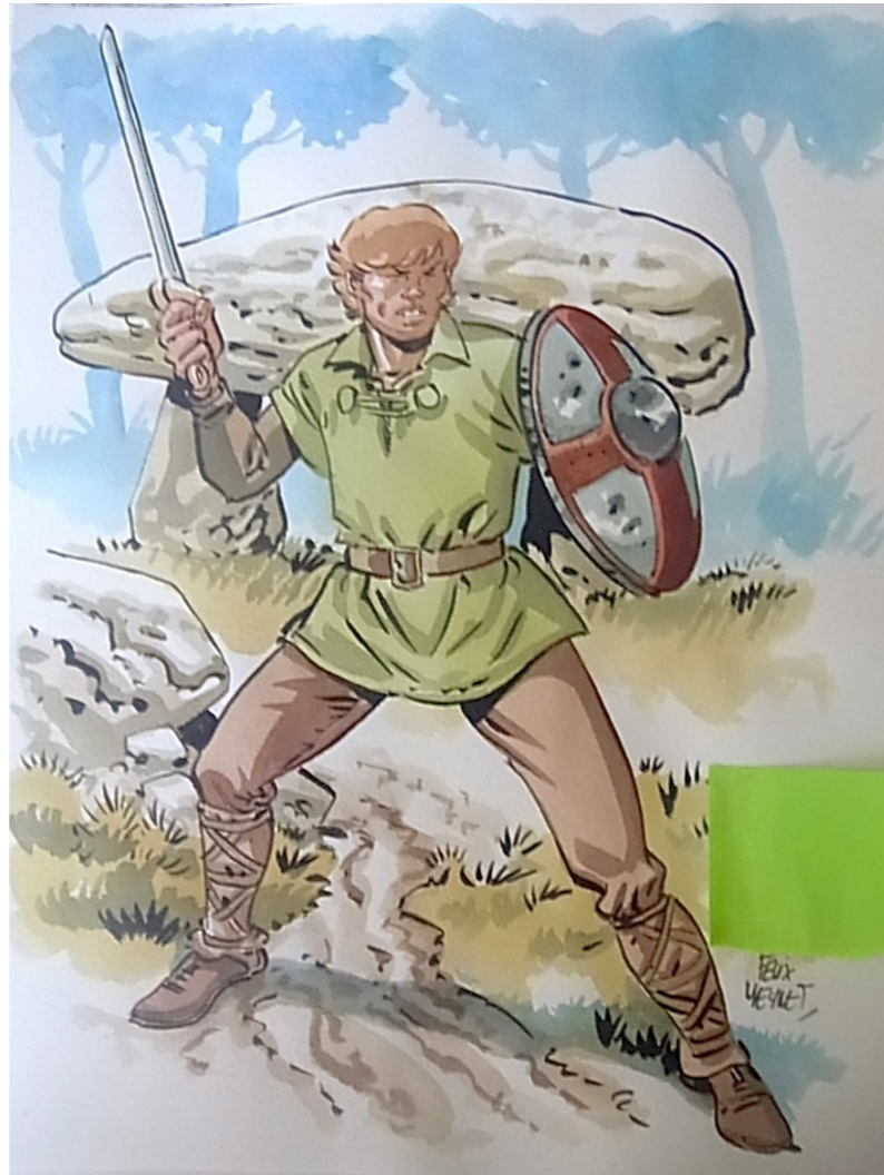
Un hommage au Timour de Sirius par Meynet